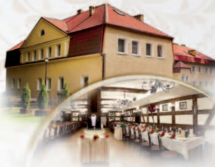
Oberża Leśna Dolina tel. 76 831 86 65 kom. 725 250 701