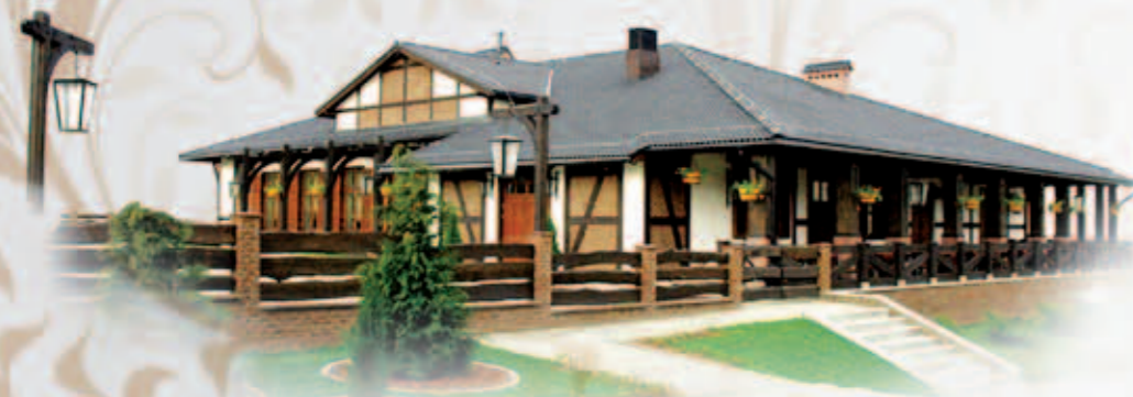
Oberża LGOM tel. 76 722 22 75

Zachęcamy do korzystania z naszych usług!