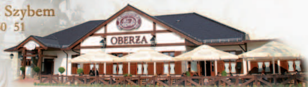
Oberża Legnica tel. 76 722 22 72