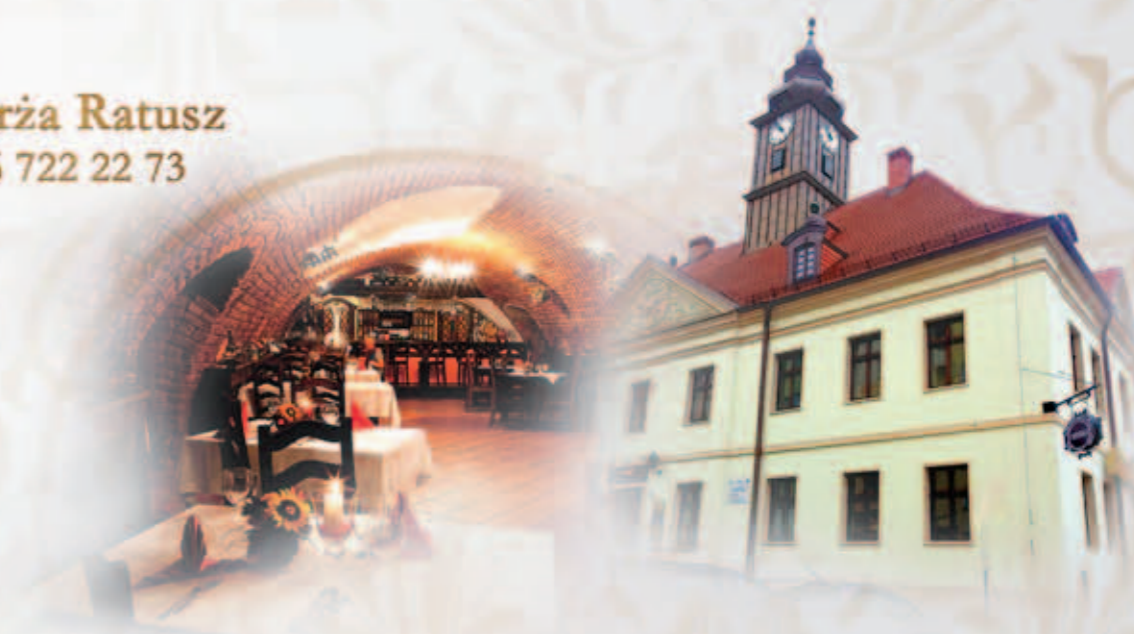
Oberża Ratusz tel. 76 722 22 73